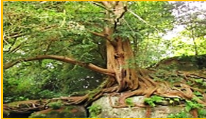
Taxus op Wakehurst Place, Ardingly, Engeland

Enigszins begrijpelijk: de taxus heeft een wortelstelsel als een megaportie spaghetti van kluwen scheepskabels.